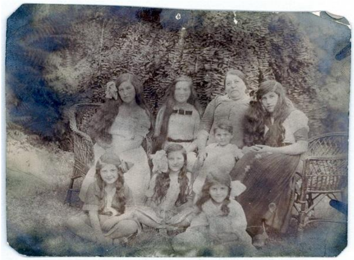
Зліва направо сидять у кріслах з нянею: